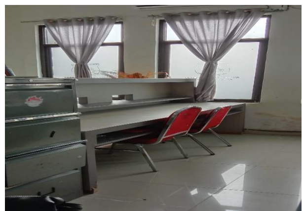
Area Petugas layanan PPID