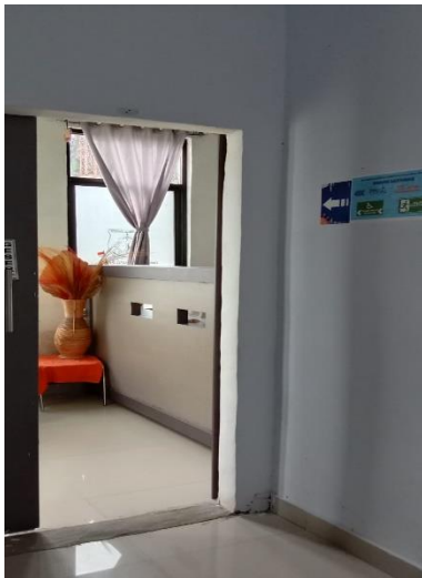
Jalur masuk ruang PPID