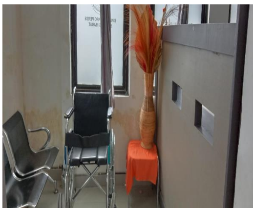
Area Pemohon Informasi dilengkapi kursi disabilitas